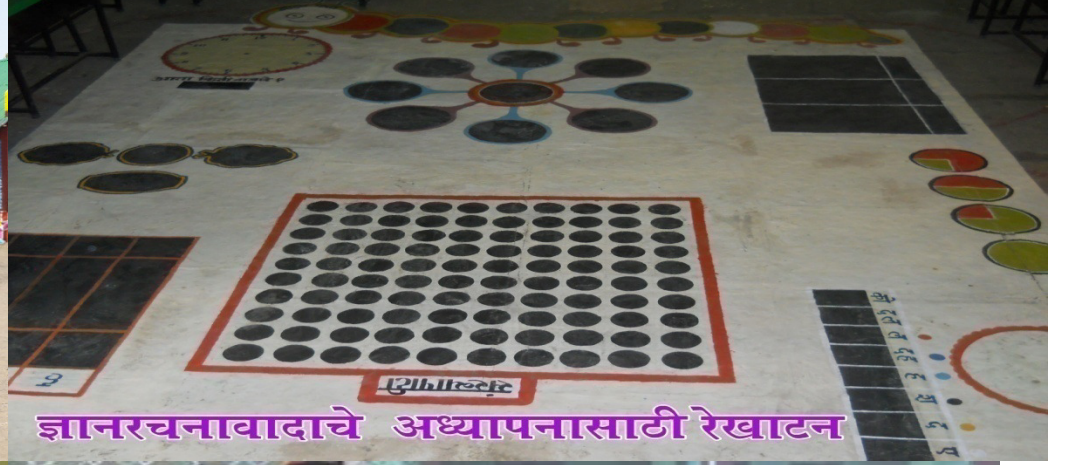
ज्ञानरचनावादाचे अध्यापनासाठी रेखाटन