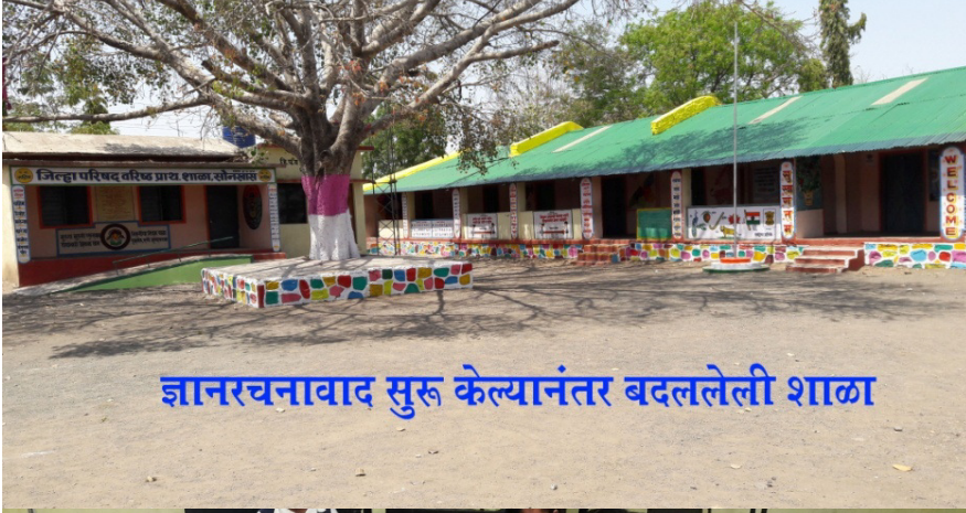
ज्ञानरचनावाद सुरु केल्यानंतर बदललेली शाळा